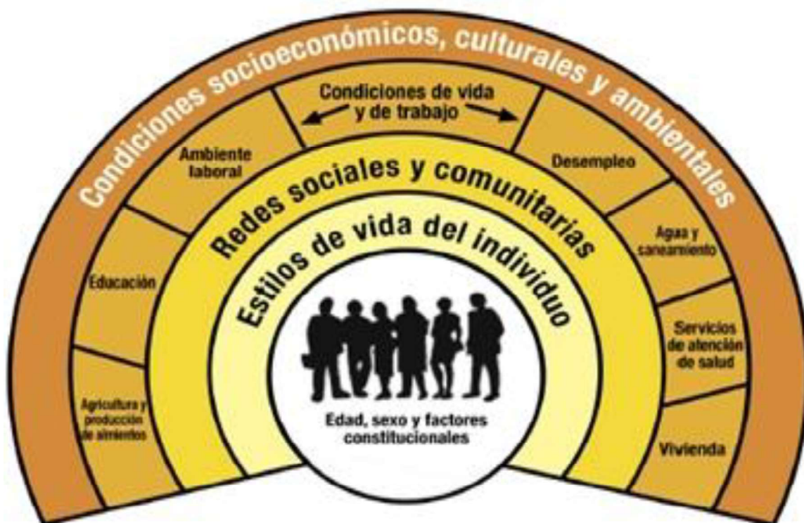
Fig. 2. Modelo Socioeconómico de Salud

En este modelo los individuos están en el centro del cuadro, dotados de edad, sexo y factores genéticos influyen en su potencial final de salud. La próxima capa representa conductas personales y estilos de vida. Las personas con carencias tienden a exhibir barreras financieras mayores para escoger un estilo de vida más saludable. Las influencias sociales y comunitarias se representan en la próxima capa. Estas interacciones sociales y las presiones de los pares influyen en las conductas personales. En el próximo nivel, encontramos factores relacionados con las condiciones de vida y trabajo, provisión de alimentos y acceso a los servicios esenciales. En esta capa, las condiciones habitacionales más pobres, la exposición a condiciones de trabajo más peligrosas o estresantes y el limitado acceso a los servicios crean los riesgos diferenciales para los menos beneficiados socialmente.